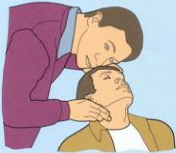
Установить наличие пульса на сонной артерии