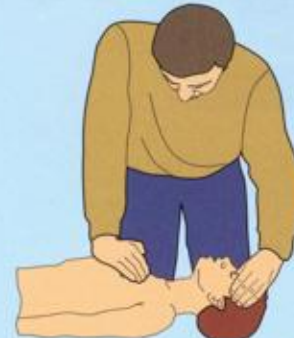
Если медицинскую помощь оказывают два человека, то один проводит массаж сердца, другой — искусственную вентиляцию лёгких