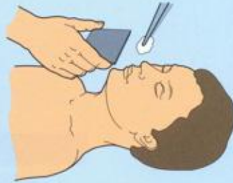
Определить состояние самостоятельного дыхания