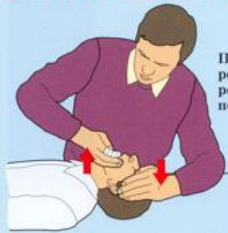
Провести ревизию ротовой полости