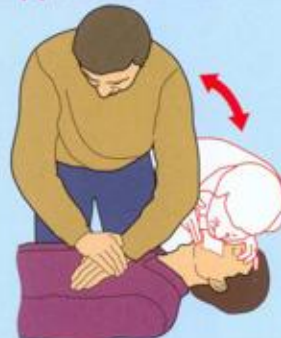
При проведении реанимационных мероприятий необходимо одновременно делать искусственную вентиляцию лёгких и наружный массаж сердца, чередуя 2 вдувания и 15 надавливаний