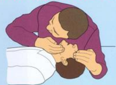
Проконтролировать наличие пассивного выдоха (по движению грудной клетки и выдыхаемому воздуху)