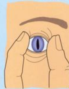
Деформация зрачка — «кошачий глаз»