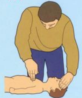
Детям до 14 лет делать до 100 надавливаний на грудину в минуту в режиме: 5 надавливаний — одно вдувание (подросткам — одной рукой, детям до 3 лет — двумя пальцами)