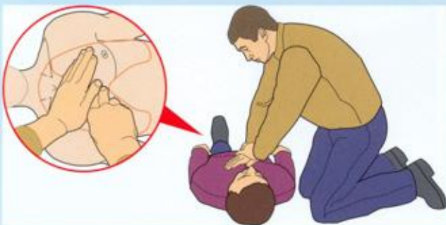
Уложить на твёрдую поверхность и делать надавливания на грудину